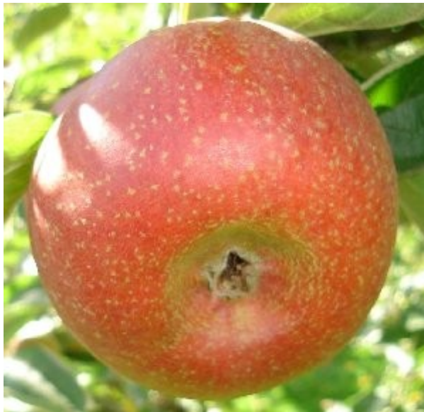
Pomme bien insolaée.

MATURITE-CONSOMMATION : Octobre-Décembre.